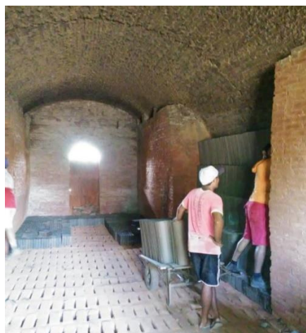
FIGURA 4. Ambiente interno do forno cerâmico.

De acordo com as etapas evidenciadas anteriormente, principalmente os procedimentos referentes a preparação da matéria-prima e extrusão são onde se encontram a maior parcela da potência instalada, atingindo aproximadamente 95% do consumo, enquanto os outros 5% são alusivos à iluminação e aos ventiladores existentes nos fornos. Nesse viés, após a identificação das irregularidades nas instalações elétricas, tornou-se necessário avaliar o consumo em kWh da vigente empresa.