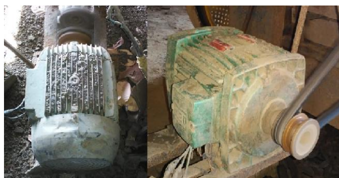
FIGURA 5. Motores elétricos da linha de produção cobertos de poeiras e partículas granuladas de argila.

No momento das medições realizadas com o alicate amperímetro, detectou-se possíveis pontos prejudiciais quanto à ventilação dos motores, tendo em vista que na maioria dessas máquinas elétricas, as aletas de ventilação estavam todas obstruídas com poeiras e partículas granuladas de argila, visto que os motores são instalados em pontos que dificultam suas limpezas. À vista disso, o responsável do setor salientou que o motor de 15cv já foi danificado diversas vezes por tais motivos. A Figura 5 denota o cenário retratado anteriormente.