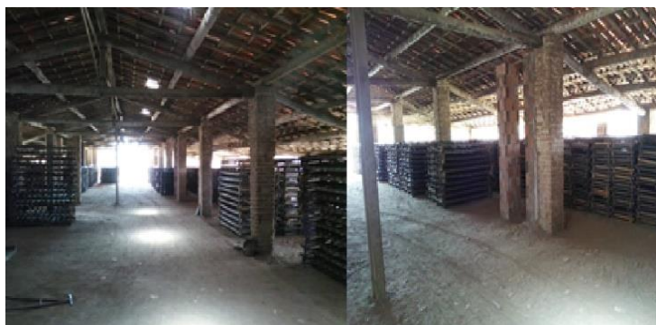
FIGURA 3. Iluminação natural da cerâmica. Autoria própria, 2020.

Por outro lado, já nos demais ambientes dos galpões 1 e 2 os níveis foram satisfatórios de acordo com a norma, visto que os valores medidos oscilavam entre 140 a 210 lux, sendo estes valores considerados convincentes, tendo em vista que a norma mencionada indica no mínimo 100 lux para recintos não usados para trabalhos contínuos ou depósitos. A Figura 3 representa o cenário descrito previamente.